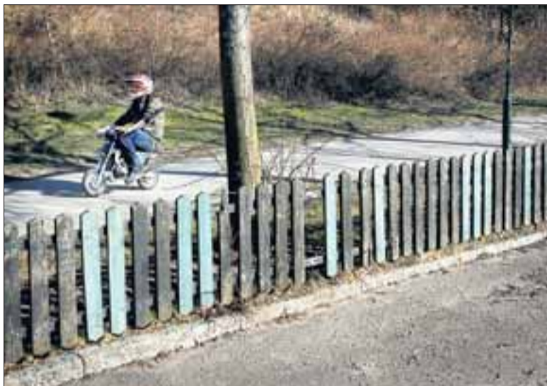
Barn som kör moped vet inte vilka regler som gäller. Skyltningen måste bli tydligare, skriver representanter för brottsförebyggande rådet i Bagarmossen. ARKIVBILD

Att barnen själva ska inse riskerna och köra "försiktigt" är osannolikt och strider mot hela deras vilja att ha moped.