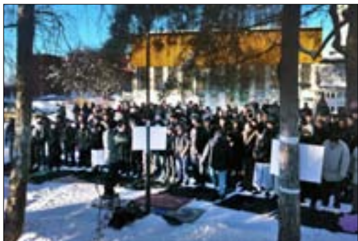
Bönen hölls utomhus med bötemattorna i snön.

Med utgångspunkt i en rapport från länsstyrelserna i december 2012 prioriteras följande områden under 2013: könsstämpning, funktionsnedsättning, barn och unga som riskerar att bli gifta mot sin vilja, barn och unga som lever med skyddad identitet samt ensamkommande barn och unga.