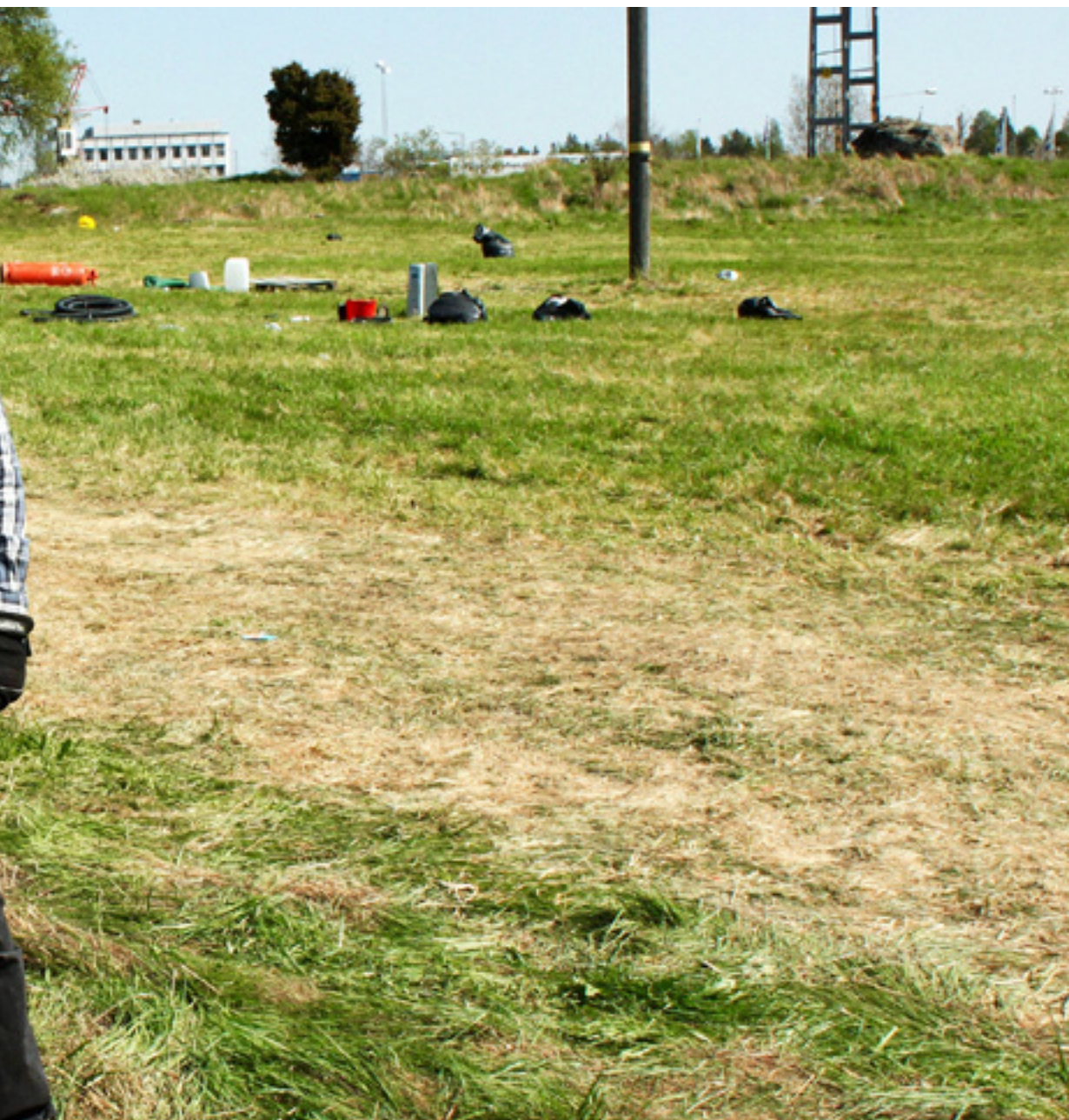
är glad att de objudna gästerna har dragit vidare.

"Rena vansinnet. Det är ju självklart att en som reser längre ska betala mer."