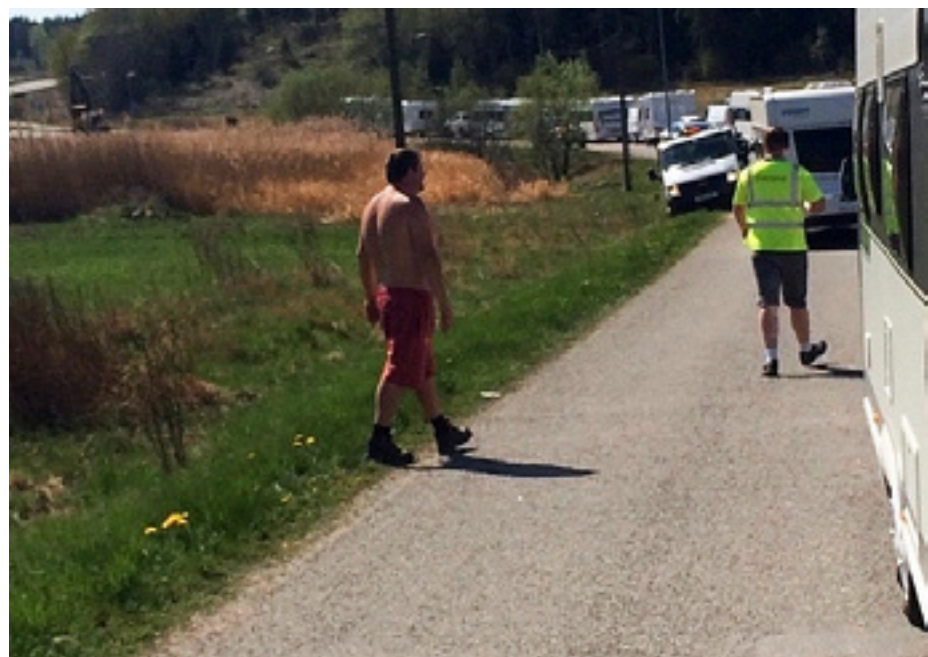
När sällskapet till slut lämnade drog de vidare några kilometer norrut och bosatte sig i Upplands Väsby.