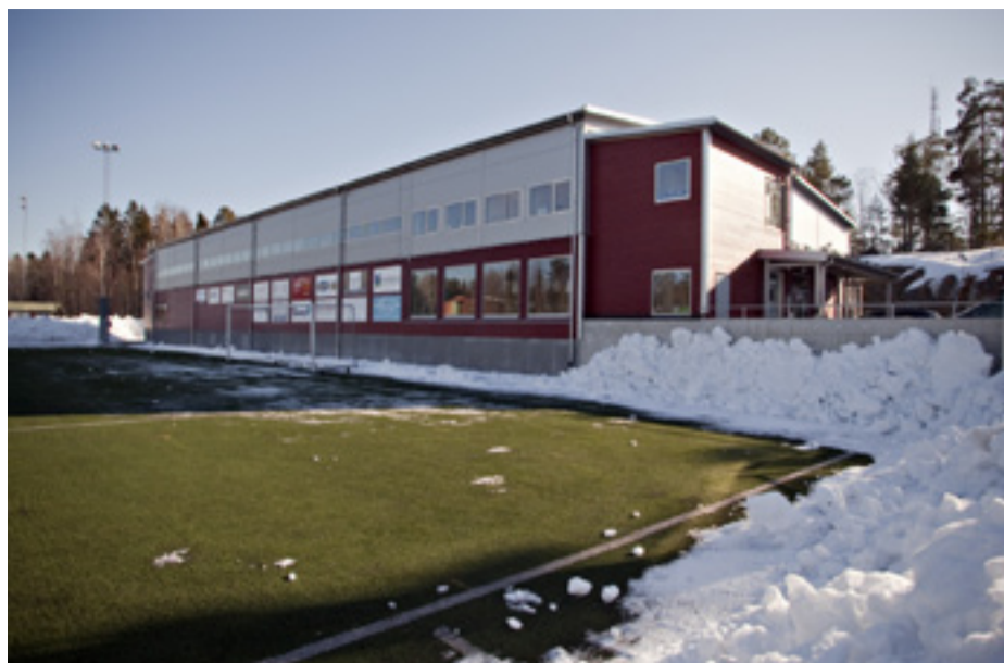
Värmdövallen får nytt konstgräs.

Erbjudandena gäller hos Stora Coop Värmdö. Med reservation för slutförsäljning. Gäller ej uteleksaker för vinter. Erbjudandena gäller t.o.m. 24/12. Sortimentet kan variera. Läs mer på coop.se/50