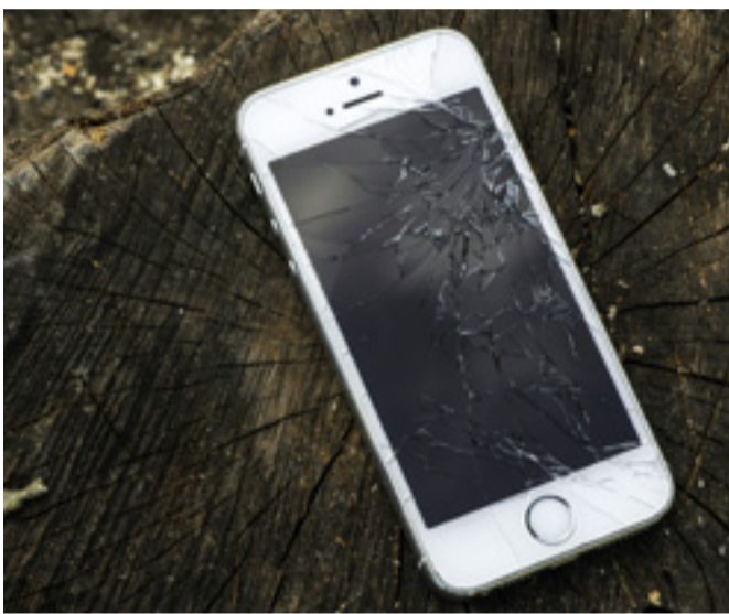
Vad gör du med dina trasiga mobiltelefoner?

Vad tycker du? Dela med dig av dina åsikter på vår Facebook-sida.