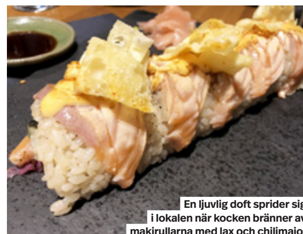
En ljuvlig doft sprider sig i lokalen när kocken bränner av makrullarna med lax och chilimajö.

I den lilla lokalen på nyöppnade Susherian bjuder krogaren Myke Olmos på nyskapande sushi med höga ambitioner.