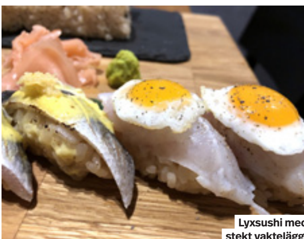
Lyxsushi med stekt vaktelägg.