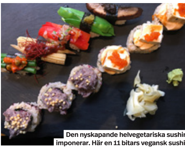
Den nyskapande helvegetariska sushin imponerar. Här en 11 bitars vegansk sushi.

Särskilt bra funkar det med fiskbitarna även om stället redan gjort sig känt för sin vegansushi.