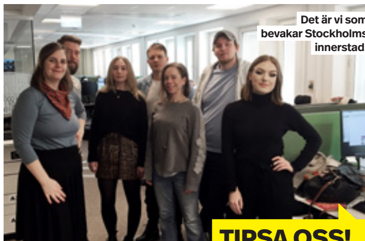
Det är vi som bevakar Stockholms innerstad!

Reporter Elin Angvarson, elin.angvarson@mitti.se Reportrar Allt om Stockholm Sandra Eriksson och Johan Thornton Nyhetschef Eric Thorsson, tel 08-550 551 23 Fotograf Pekka Pääkkö Mejla oss gärna enligt formen fornamn.efternamn@mitti.se Eller ring oss på telefon 08-550 550 00 – i växeln hjälper vi dig att komma i kontakt med rätt person. Dagliga nyheter på: www.mitti.se/ostermalm Facebook: "Mitt i Östermalm" Twitter: @mittistockholm Instagram: @mittistockholm