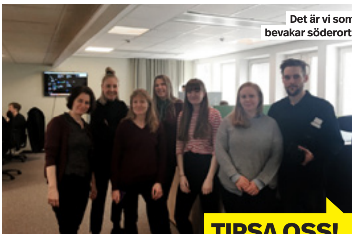
Det är vi som bevakar söderort!

Reporter Pernilla Fagerström, pernilla.fagerstrom@mitti.se Reporter Jonna Andersson, jonna.andersson@mitti.se Nyhetschef Karolina Andersson, tel 08-550 550 01 Fotograf Christian Lärk Mejla oss gärna enligt formen fornamn.efternamn@mitti.se Eller ring oss på telefon 08-550 550 00 - i växel hjälper vi dig att komma i kontakt med rätt person. Dagliga nyheter på: www.mitti.se/bandhagen Facebook: Sök på "Mitt i Söderort - Bandhagen" Twitter: @mittistockholm Instagram: @mittistockholm