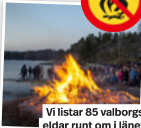
Vi listar 85 valborgseldar runt om i länet.