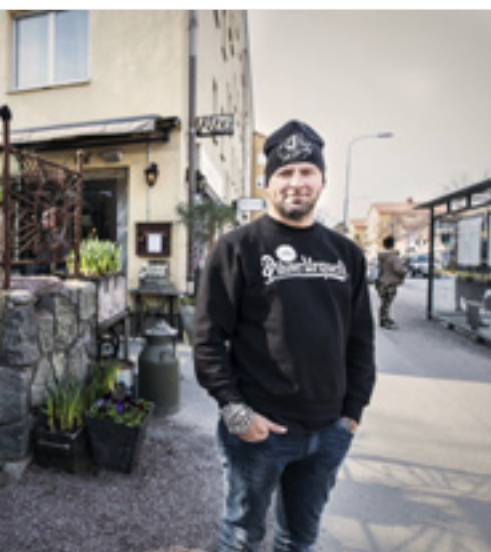
utanför krogen Två små svin, som har fått ett besökare.