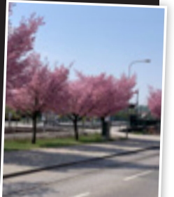
Körsbärsträd längs tvärbanespåren i Årsta.