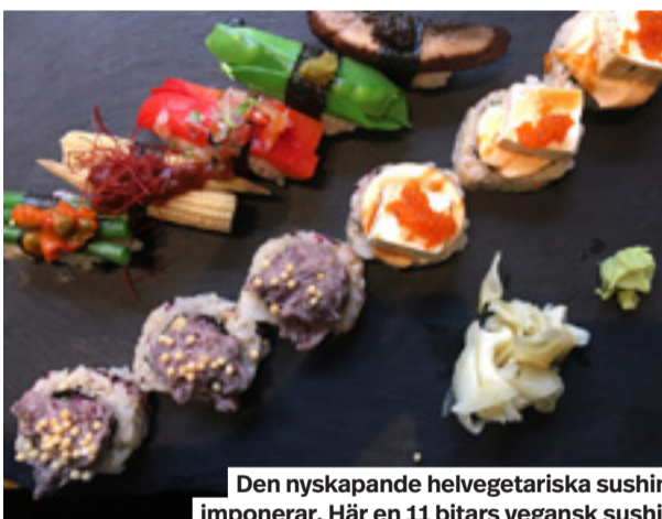
Den nyskapande helvegetariska sushin imponerar. Här en 11 bitars vegansk sushi.

Särskilt bra funkar det med fiskbitarna även om stället redan gjort sig känt för sin vegansushi.