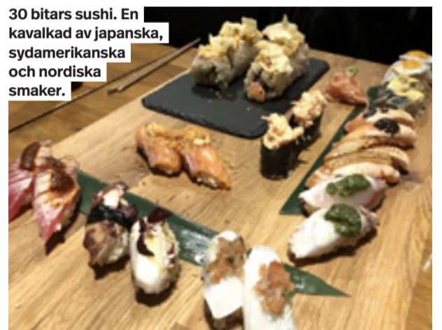
30 bitars sushi. En kavalkad av japanska, sydamerikanska och nordiska smaker.