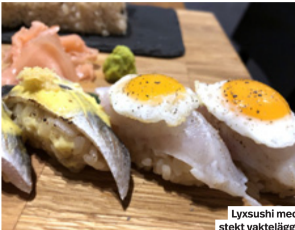
Lyxsushi med stekt vaktelägg.