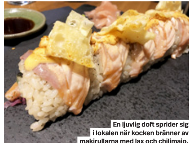
En ljuvlig doft sprider sig i lokalen när kocken bränner av makrullarna med lax och chilimajjo.

I den lilla lokalen på nyöppnade Susherian bjuder krogaren Myke Olmos på nyskapande sushi med höga ambitioner.