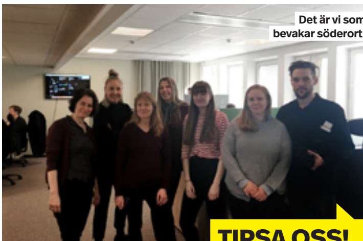
Det är vi som bevakar söderort!