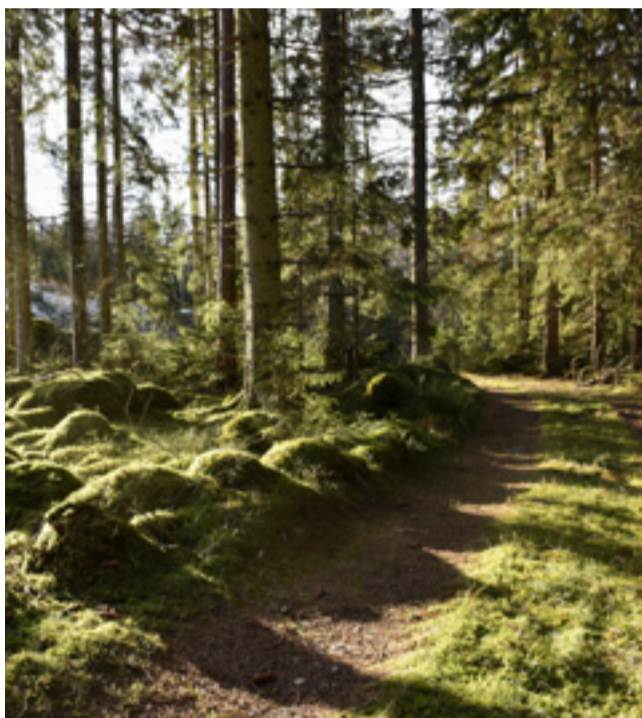
Naturen skänker tröst.

Fatta dig kort – då ökar chansen att komma med.