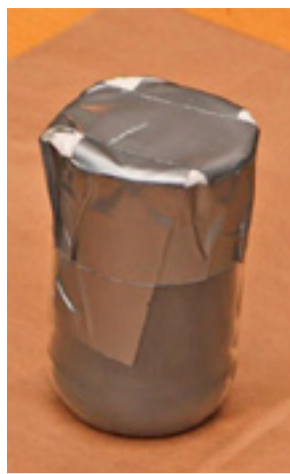
Burken innehöll cirka 500 gram så kallat flashpowder – en kraftig bomb, enligt expertis.