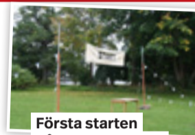
Första starten på Lidingö 2010...