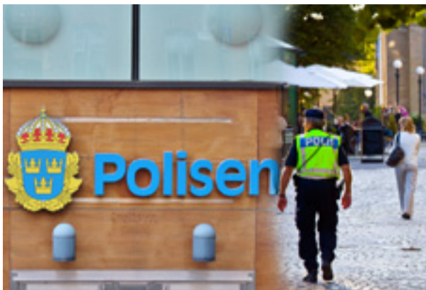
Stockholmspolisen återanställer nu tidigare medarbetare.