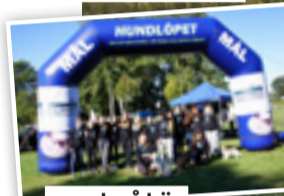
...och så här såg det ut 2018.