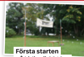
Första starten på Lidingö 2010...