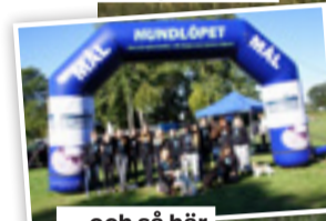
...och så här såg det ut 2018.