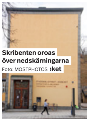
Skrubben oroas över nedskärningarna