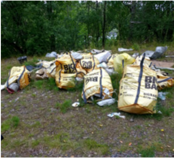
Ett tiotal säckar har dumpats.