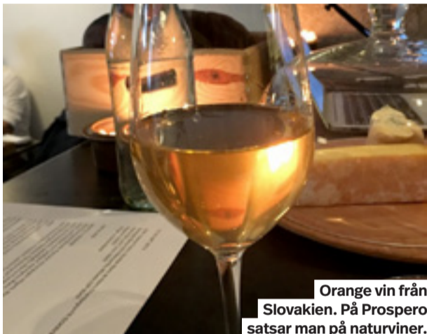
Orange vin från Slovakien. På Prospero satsar man på naturviner.