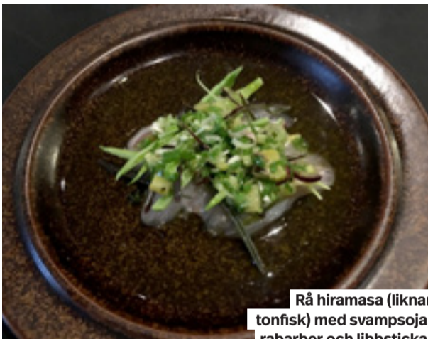
Rå hiramasa (liknar tonfisk) med svampsoja, rabarber och libbsticka.