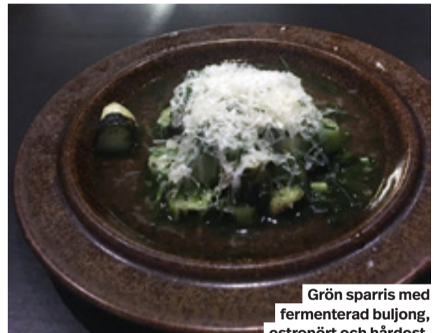
Grön sparris med fermenterad buljong, ostronört och hårdost.

Accepterar du blommor i maten och smör gjort på resterna av förra veckans svampbrätt så har du kommit rätt. Och när köket arbetar med ett begränsat antal råvaror varje vecka sprudlar i stället kreativiteten.