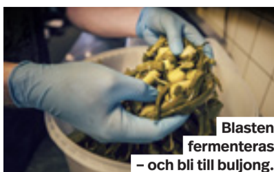
Blasten fermenteras – och bli till buljong.