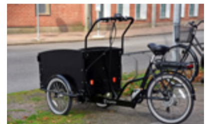
Passar i glesbygden?