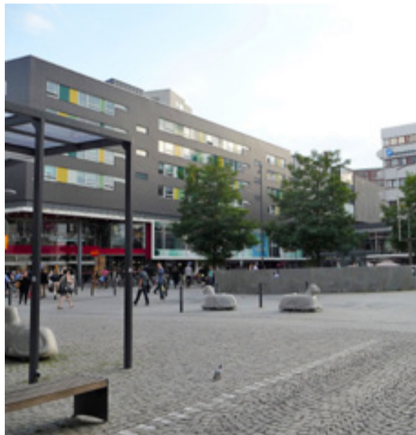
Dags att visa tonåringarna att de inte äger torget, tycker signaturen "Liljehomsbo".