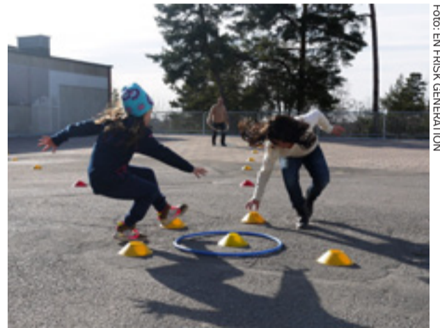
Barn ska inspireras att röra sig mer.

UTSATT EU-MEDBORGARE uppskattas befinna sig i Stockholms län. Totalt 5 000 uppskattas befinna sig i Sverige. Hur många av dessa som tigger är dock oklart. Källa: Landets kommuner, polisen, välgörenhetsorganisationer