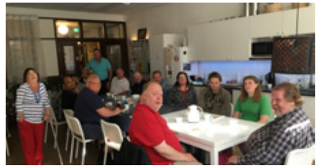
På Solstrålen finns möjlighet att mötas, fika, spela och ha olika aktiviteter.