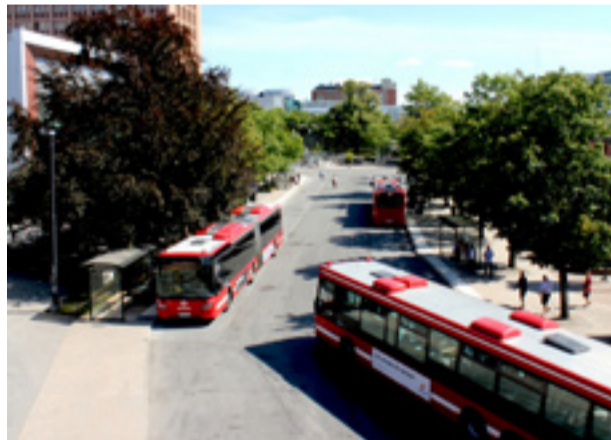
Färre får plats på bussen och resan tar längre tid än pendeltåget, påtalar skribenten.

● Tack för alla hundar som har ägarwwe som fostrat dem att inte skälla i tid och otid i rastgårdar. Skäms alla andra, som rastar hundar men inte bryr sig om att de stör. HUNDVÄN