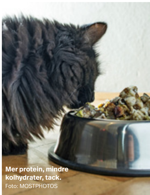
Mer protein, mindre kolhydrater, tack.

mål, färg- och smakämnen så skippa det. Det är så otroligt vanligt numera att katter får diabetes och andra "moderna" sjukdomar, som sedan ska medicineras bort, när det från början handlar om att de har fått fel mat av sin ägare. Du sparar både tusentals kronor i vårdavgifter, livslängd och år av pina för din katt om du tänker, läser och reflekterar över maten du ger din katt. MAMMA MIAOU