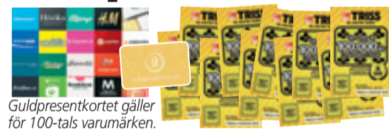
Guld-presentkortet gäller för 100-tals varumärken.

Rutorna med de röda siffrorna bildar en lösningskod som kan utläsas som ett fyrsiffrigt tal – t ex NIO ETT TJUGO (9120). Du kan ringa , swisha eller SMS:a in koden.