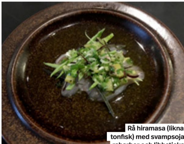
Rå hiramasa (liknar tonfisk) med svampsoja, rabarber och libbsticka.