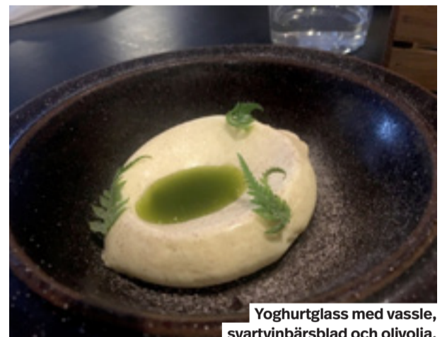
Yoghurtglass med vassel, svartvinbärsblad och olivolja.