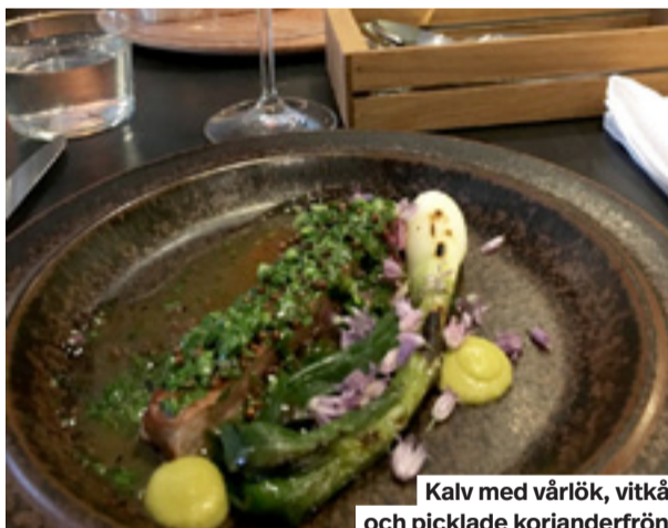
Kalv med vårlök, vitkål och picklade korianderfrön.

Det är fermenterat, syrat och toppat med olika buljonger. Förutom nybyggarglädjen som finns på tallriken märks kockarnas klassiska skolning på stans finare krogar.