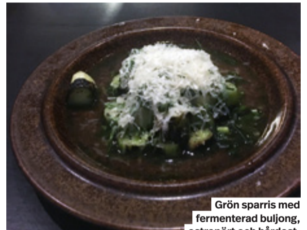
Grön sparris med fermenterad buljong, ostronört och hårdost.

Accepterar du blommor i maten och smör gjort på resterna av förra veckans svamprätt så har du kommit rätt. Och när köket arbetar med ett begränsat antal råvaror varje vecka sprudlar i stället kreativiteten.