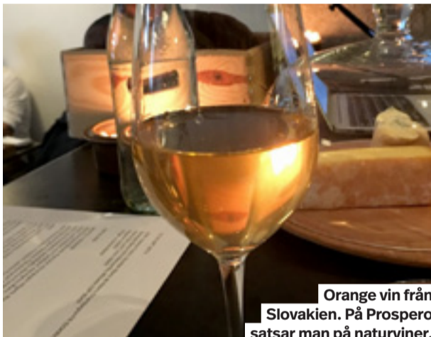
Orange vin från Slovakien. På Prospero satsar man på naturviner.