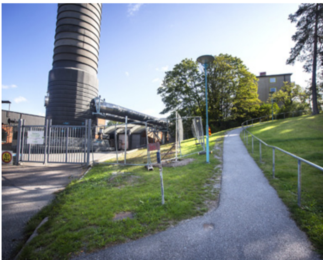
Väskan hittades i ett buskage intill ett staket vid värmeverket.