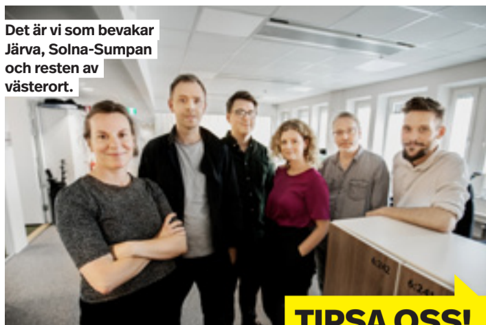
Det är vi som bevakar Järva, Solna-Sumpan och resten av västerort.

Facebook: Sök på "Mitt i Tensta-Rinkeby" Twitter: @mittistockholm Instagram: @mittistockholm