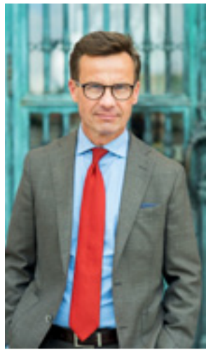
Kristersson vill införa visitationszoner i utsatta områden.