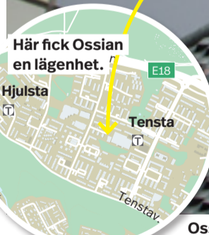
Här fick Ossian en lägenhet.