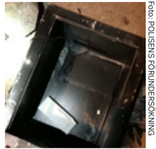
Tjuvarna slog sönder flera fönsterrutor under inbrottet.