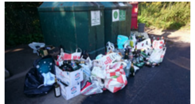
En inte helt ovanlig syn.