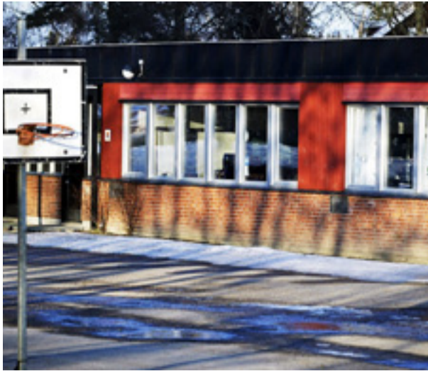
Den 29 juli bröt sig någon in på Karlbergsskolan och förstörde ett säkerhetsskåp för datorer.