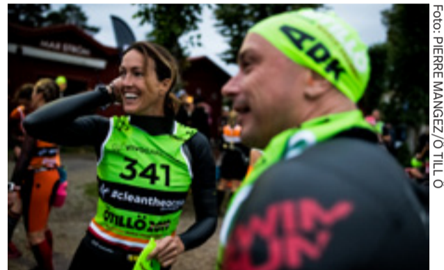
Förra världsstjärnan i simning Therese Alshammar och artisten Petter tävlade tillsammans i mix-klassen i Ö till Ö.