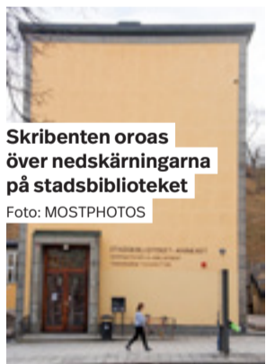
Skribenten oroas över nedskärningarna på stadsbiblioteket