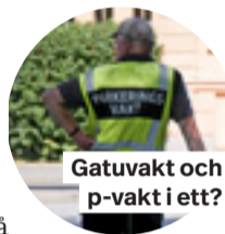
Gatuvakt och p-vakt i ett?