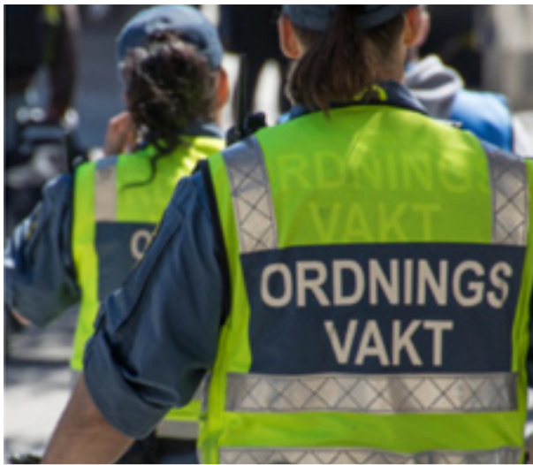
Förordnandet för stadens ordningsvakter vid Hässelby torg förlängs.