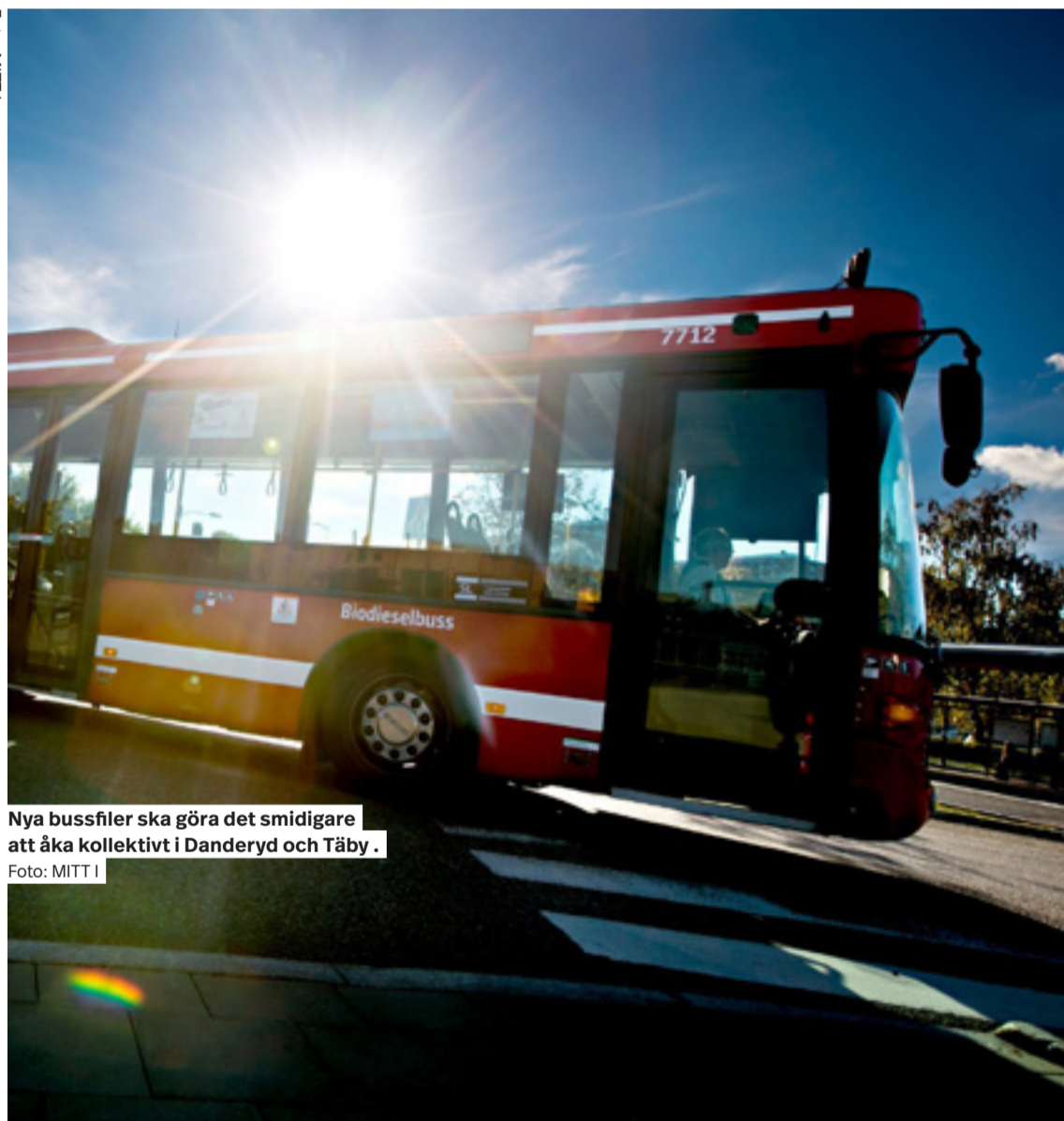
Nya bussfiler ska göra det smidigare att åka kollektivt i Danderyd och Täby.