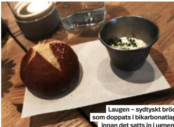
Laugen – sydtyskt bröd som doppats i bikarbonatlag innan det satts in i ugnen.