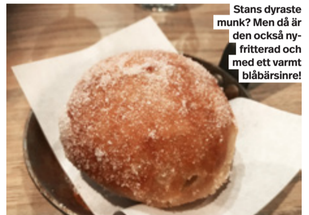
Stans dyraste munk? Men då är den också ny-friterad och med ett varmt blåbärsinre!