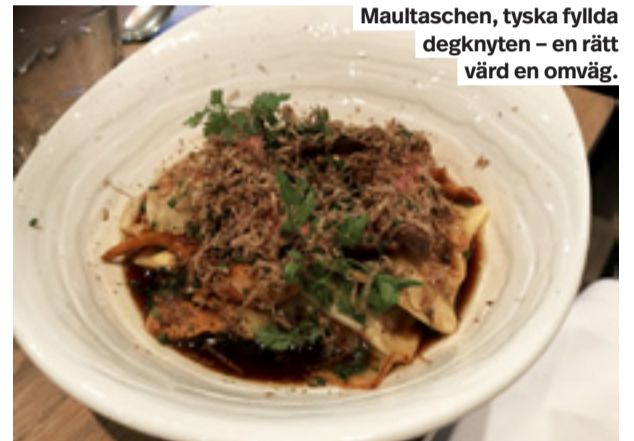
Maultaschen, tyska fyllda degknyten – en rätt värd en omväg.

En ny krogpärla har öppnat i Foods gamla lokaler.