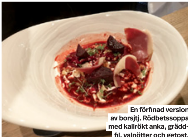
En förfinad version av borsjtj. Rödbetsoppa med kallrökt anka, gräddfil, valnötter och getost.