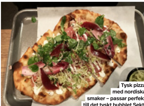
Tysk pizza med nordiska smaker – passar perfekt till det tyskt bubblat Sekt.

Särskilt maultachen, tyskarnas svar på ravioli, är ett alptoppshögt utrops-tecken. Det är en mustig smakbomb, perfekt för en kall höstdag.