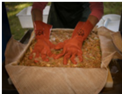
Must var det här!