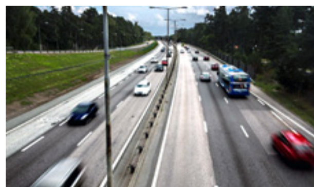
Riksväg 73 i höjd med Enskede.