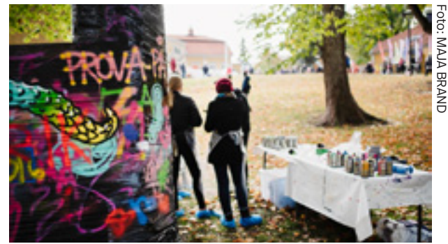
Så här såg det ut på 1 000 meter konst i Huddinge 2018.