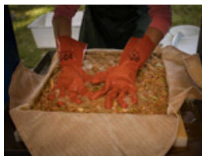
Must var det här!