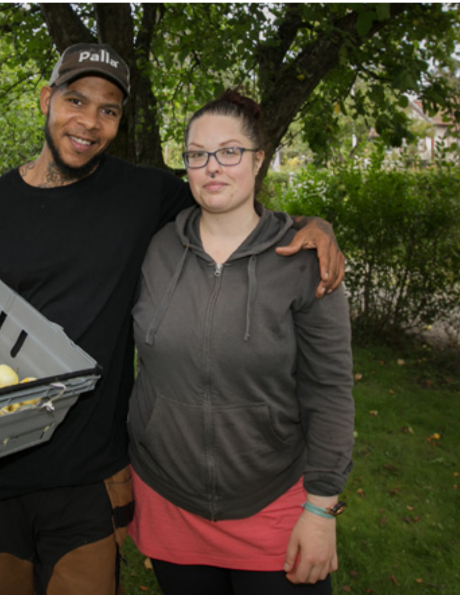
av frukten. Efter plockning städar de och gör fint under träden.

Upprustningen har sammanlagt kostat 16 miljoner kronor.