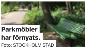
Parkmöbler har förnyats.