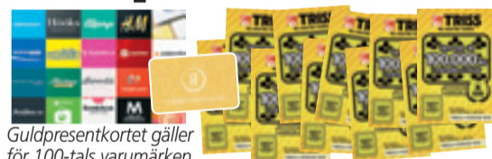
Guld-presentkortet gäller för 100-tals varumärken.

Rutorna med de röda siffrorna bildar en lösningskod som kan utläsas som ett fyrsiffrigt tal – t ex NIO ETT TJUGO (9120). Du kan ringa , swisha eller SMS:a in koden.