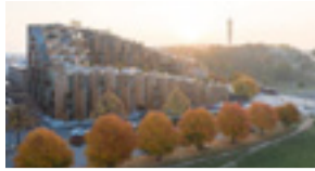
ILL: LAURAN GHINTOIU

Köparen ville häva köpet eftersom tillträdet försejats, dessutom anser köparen att kontraktet innehåller formfel. Men tingsrätten anser att tillträde erbjudits två månader efter den senaste