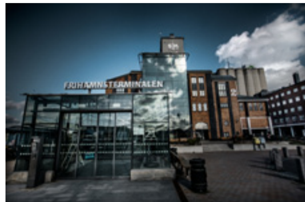
Hit, till Frihamnsterminalen magasin 2, sökte sig anhöriga under natten för 25 år sedan.

– De anhöriga sökte svar hos oss. Vi släppte in alla i terminalen och höll journalisterna utanför. Vi hämtade filter, tröstade och försökte förklara att vi inte alls vet hur det gått för deras anhöriga, att vi får återkomma. Det var, som om någon uttryckt det, som en efterkrigszon –