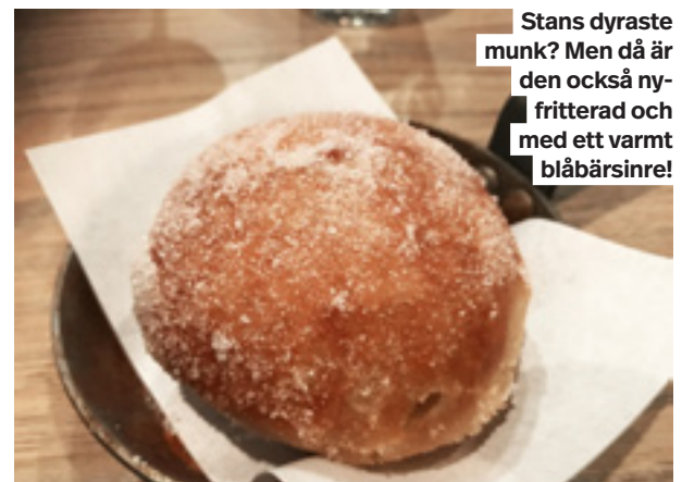
Stans dyraste munk? Men då är den också ny-friterad och med ett varmt blåbärsinre!