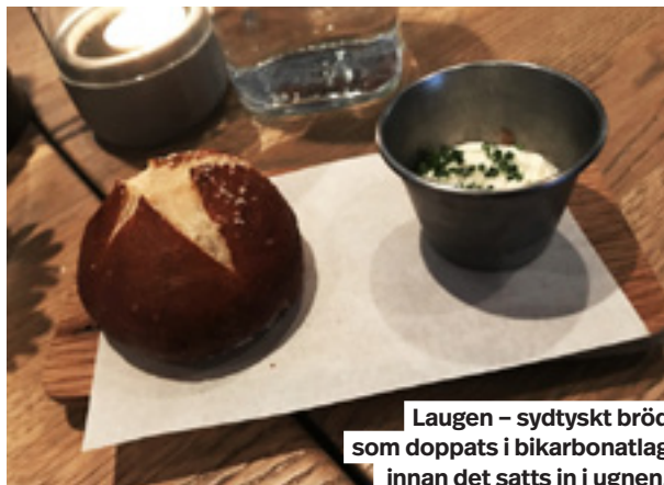
Laugen – sydtyskt bröd som doppats i bikarbonatlag innan det satts in i ugnen.