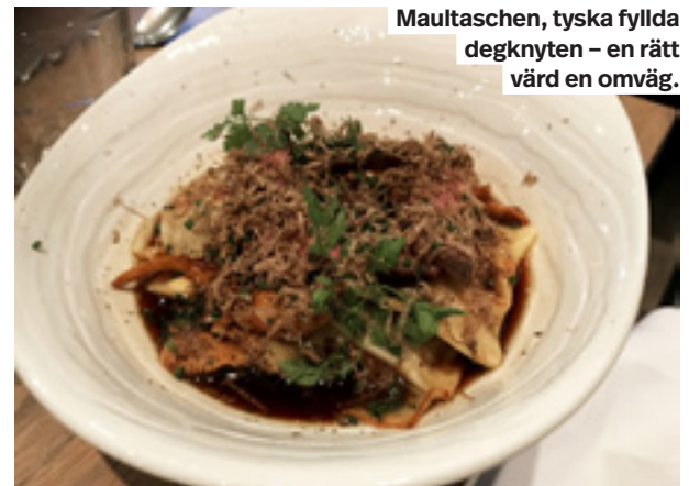
Maultaschen, tyska fyllda degknyten – en rätt värd en omväg.

En ny krogpärla har öppnat i Foods gamla lokaler.