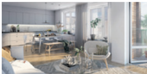
RUM MED RYMD – Öppna och välplanerade planlösningar för ett rymligare lägenhetsliv.

Ägarlägenheter är en vanlig boendeform i resten av Europa och blir allt vanligare i Sverige. Genom tredimensionell fastighetsbildning blir lägenheten en egen fastighet som köps och ägs på samma sätt som ett friköpt radhus eller en villa. Det betyder även att man som köpare inte delar några lån med andra. Man slipper gemensamma amorteringar och räntor, kostnader som ofta utgör stor del av bostadsrättens ekonomi. Drift och underhåll av gemensamma delar förvaltas av en samfällighetsförening. Sammantaget ger det stor kontroll över den egna ekonomin och en trygghet om byggnadens framtida underhåll.