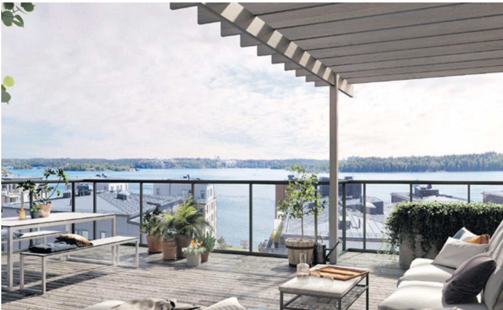
PENTHOUSEKÄNSLA – Högst upp i Ypsilon ligger lägenheter med stora terrasser och fin vattenutsikt ut över Saltjön, Nacka och Stockholms inlopp.