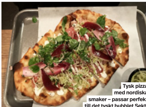
Tysk pizza med nordiska smaker – passar perfekt till det tyskt bubblat Sekt.

Särskilt maultachen, tyskarnas svar på ravioli, är ett alptoppshögt utrops-tecken. Det är en mustig smakbomb, perfekt för en kall höstdag.