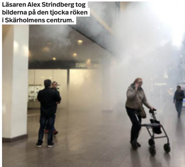
Läsaren Alex Strindberg tog bilderna på den tjocka röken i Skärholmens centrum.