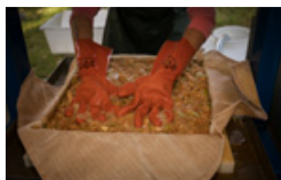
Must var det här!