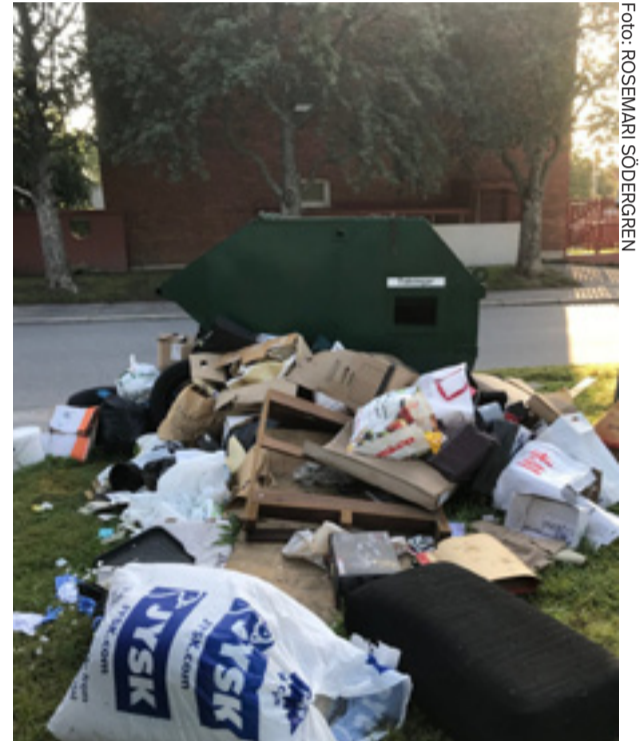
Så här såg det ut vid singelstationen på Bygatan för ett par veckor sedan.

Källa: Lennart Svahn, uppslagsverket Svenska äpplen.