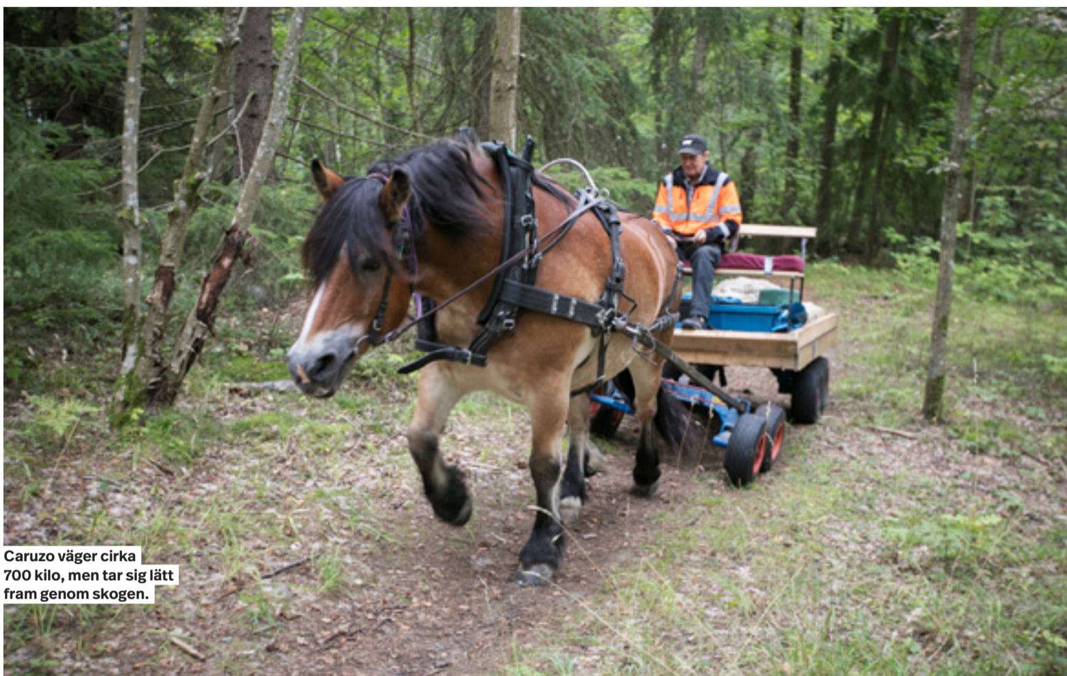
Caruzo väger cirka 700 kilo, men tar sig lätt fram genom skogen.

Caruzo tar sig snabbt fram till den första grillplatsen.