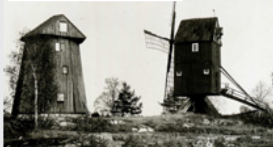
Bilden visar Rinkeby kvarnhöjd som Kvarnkullen hette i början av 1900-talet. I vänster på bilden syns även "Holländskan", uppförd på platsen 1885 och nerbränd 1989. Kvarnen är Stora Stampan.