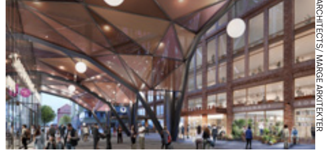
ILL: SWECOARCHITECTS/ MARGE ARCHITEKTER

Vy västerut genom Arkaden sedd från östra torget mot tunnelbaneuppgången vid Lysgränd.