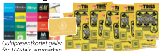
Guld-presentkortet gäller för 100-tals varumärken.

Rutorna med de röda siffrorna bildar en lösningskod som kan utläsas som ett fyrsiffrigt tal – t ex NIO ETT TJUGO (9120). Du kan ringa , swisha eller SMS:a in koden.