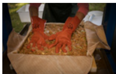
Must var det här!