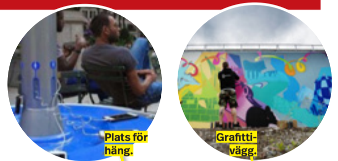
Plats för häng.