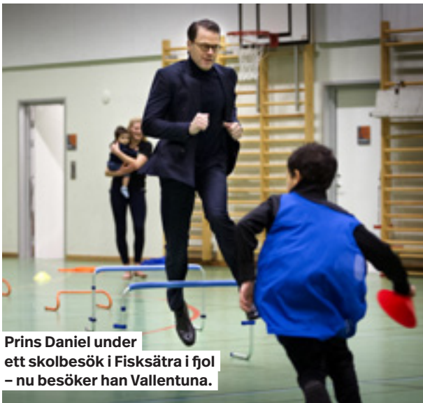
Prins Daniel under ett skolbesök i Fisksätra i fjol - nu besöker han Vallentuna.